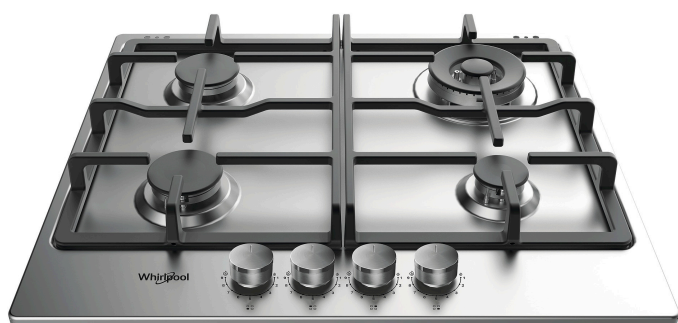
Table de cuisson au gaz Whirlpool: 4 brûleurs gaz - TKRL 661 IX EU

Des technologies et caractéristiques standards vous facilitant la vie.