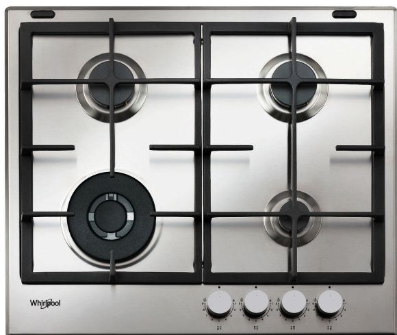
Table de cuisson au gaz Whirlpool: 4 brûleurs gaz - GMAL 6422/IXL

Cette table de cuisson au gaz Whirlpool présente les caractéristiques suivantes : surface anti-tache iXelium pour un nettoyage sans effort.