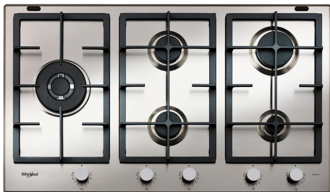
Table de cuisson au gaz Whirlpool: 5 brûleurs gaz - GMAL 9522/IXL

Cette table de cuisson au gaz Whirlpool présente les caractéristiques suivantes : surface anti-tache iXelium pour un nettoyage sans effort.