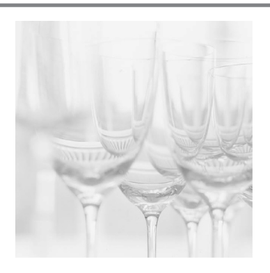
Οδηγίες χρήσης Instrukcje użytkowania Használati utasítás Инструкция за употреба Қолдану бойынша нұсқаулық