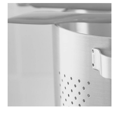
Návod k použití Návod na použitie Instrucțiuni de utilizare Инструкции по эксплуатации Інструкція з експлуатації